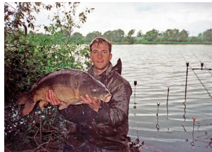
Friedfisch-Angler mit Spiegelkarpfen

Herausgeber: Landesamt für Verbraucherschutz, Landwirtschaft und Flurneuordnung (2007)